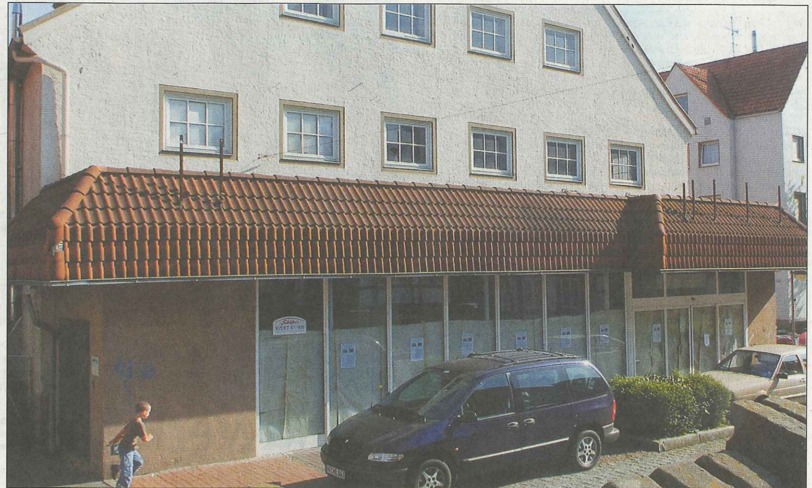
Der ehemalige Allfrisch stand lange Zeit leer. Seit einiger Zeit ist er wieder vermietet. Nach den aktuellen Planungen soll das Geschäftshaus